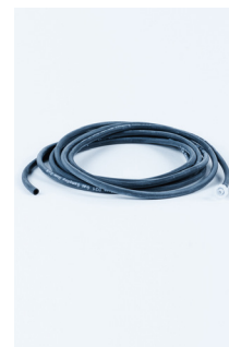
Tuyau à faible adsorption