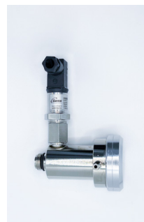
Détendeur à la demande