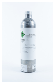
Bouteille de gaz